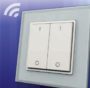
Bryter 2-Kanal RF SC El. nr 1410577