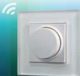
Potmeter RF SC El. nr 1410500