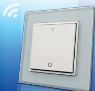
Bryter 1-Kanal RF SC El. nr 1410576